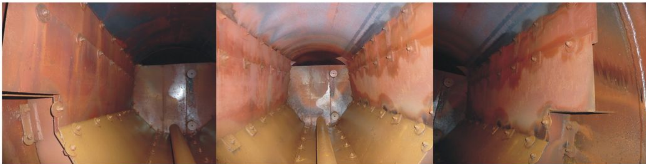
Внутренняя поверхность барабана парового котла ДЕ 25-14 («соленый» отсек) после консервации